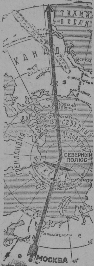
Трасса беспосадочного перелета.