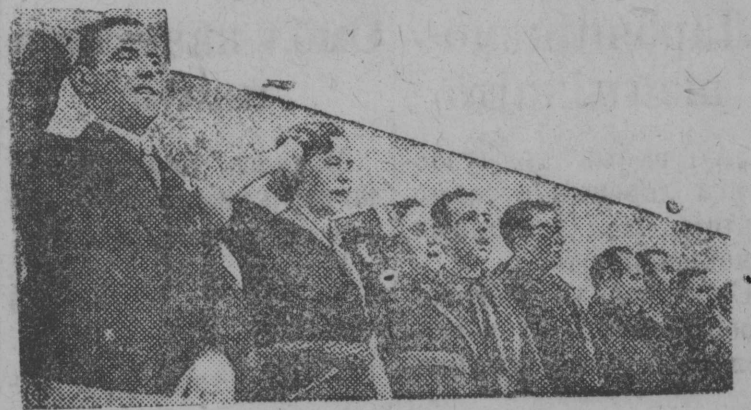
На си: испанская делегация в зале заседания во время исполнения Интернационала.

Мi „Гõрд партизан“ колхозса колхозникјас асланыс колхозник собрание вылын обсујдајтим да лыдõм газетјас вылые Испанияса героическõй jõз тыш jылые