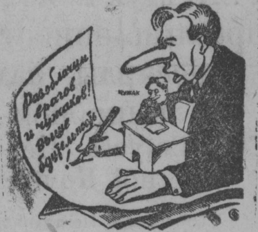
Люди, много болтающие о революционной бдительности и незамечающие врага у себя под носом—только вредят делу