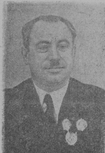
СНИМОК ВЫЛЫН: „И. СТАЛИН“ ледокол вывса экспедицияын начальник—Советскöй Союза Герой И. Д. Папанин.

дывательнöй да боевöй полётъяс, разнöй районъясын уськöдöма прöтивниклысь 7 самолёт.