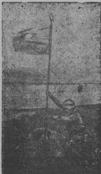
НА СОПКЕ ЗАОЗЕРНОЙ ГОР- ДО ЗАРЕЯЛО КРАСНОЕ ЗНАМЯ.

Младшöй командир комсомо- лец Бовкун јортлöн орудјинöй расчет јапонскöй бандитјас ку за востис сешöм терыб би- мыј подносчикјас ез вевјавны важвын снарадјас. Öдö, отлич- нöја ужалис наводчик-красноар- мејец Крыско јорт. Бовкинлöн