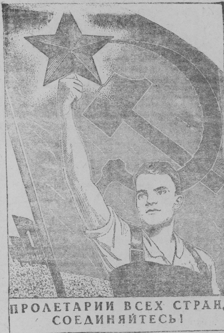
Художник В. Корецкијлбн плакат, кобiс лежбма „Искусство“ издателствои.

Первомајскiй демонстрацијас i таво петкбдласны несокрушимiй вынсi советскiй народлыс, кодi муно коммунизмi помтbма радејтана аслас вождi, друг да учител Сталин јорт вескбдлбм улын.