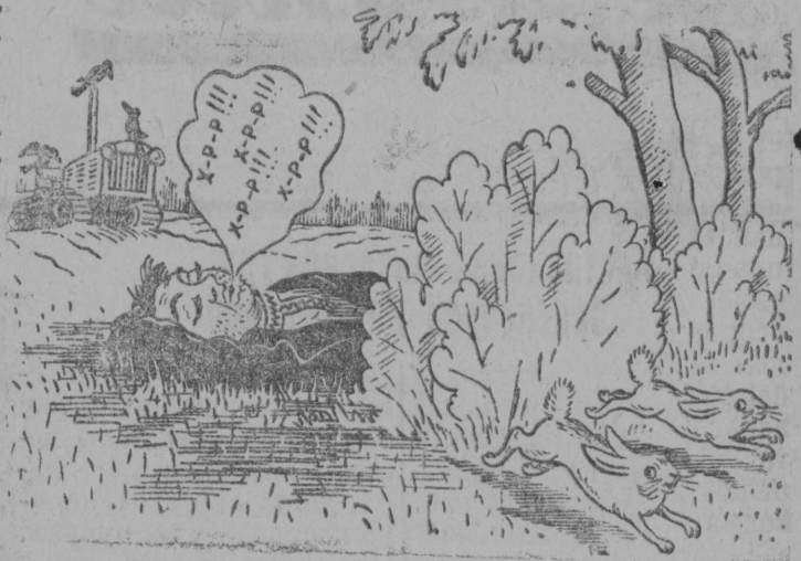
Зайцы: „Спасайся, братцы!.. Трактор заработал...“ Рис. В. В. Бали.

(Из доклада т. Н. С. Хрущева на совещании партийного, советского и колхозного актива Киевской области).