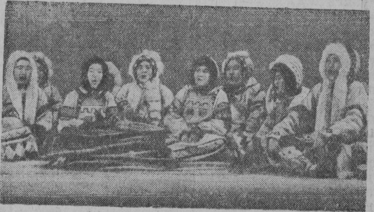
Ансамбль эвенков исполняет народные песни на заключительном концерте бурят-монгольского искусства в Москве.

торъя охотникьяс, кызди Мезенцев П. В., Мартюшев С. М. да Мезенцев Н. В. XVIII партконференциялы пöдарок шыдди 1941 вося февраль 15 лун кезлö кёсийсисны кыйны да сдایتны бур качества пушнина 1000 шайт донён морт вылö. В. ПОПОВ.