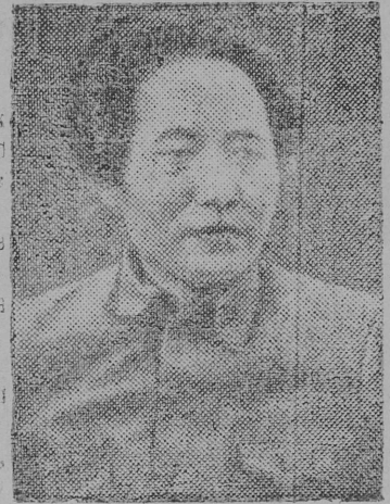
На снимке: Мао Цзе-Дун глава правительства особого рій на китайской республике — один из виднейших руководителей Китайской Коммунистической партии и VIII-ой Китайской народно-революционной армии.