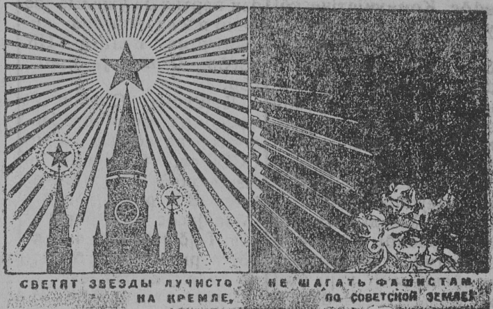
Рис. „Прессклише“ с плаката художника Б. Пророкова. Текст Н. Черемных.

ПАРТИНБЈ ОРГАНИЗАЦИЈА ЈАС ОБСУЖДАЈТБНЫ XV-ДБ КОМИ ОБЛАСТНБЈ ПАРТИНБЈ КОНФЕРЕНЦИЈА УЖЛЫС ИТОГЈАС. КОММУНИСТЈАСЛБН МОГ—МОБИЛЗУЈТНЫ СТАВ ВИНЈАС НАРОДНБЈ ОВМОС СТАВ ЈУКБНЈАСЫГ ВРЕДИТЕЛСТВОЛЫГ ПОСЛЕДСТВИЕЈАС БЫРБББМ ВЫЛБ, ПАРТИНБ-ПОЛИТИЧЕСКБЈ УЖ ВОББ КЫПБББМ ВЫЛБ.