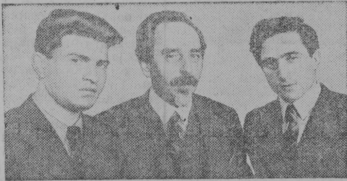
На снимке Эмиль Гилельс (слева), профессор С. Е. Фейнберг и Яков Флиер.

На международном конкурсе пианистов им. Эжена Изаи в Брюсселе с огромным успехом выступили советские пианисты Яков Флиер и Эмиль Гилельс: Эмилю Гилельсу присуждена первая премия, Якову Флиеру—третья. В качестве члена жюри конкурса участвовал заслуженный деятель искусств, профессор Московской Консерватории С. Е. Фейнберг.