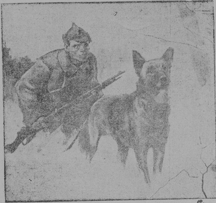
Снимок вылын: „Секреты“—Художник К. К. Жабалон.