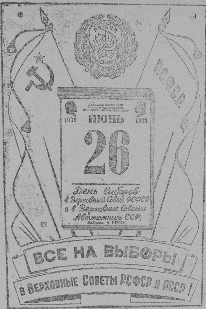
„Все на выборы в Верховные Советы РСФСР и АССР!“