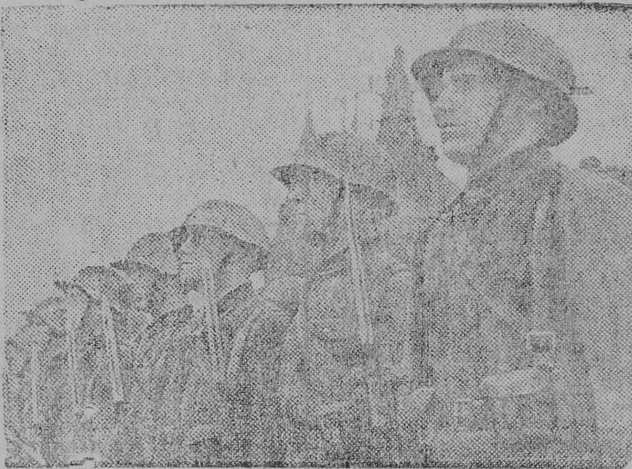
Снимок вылын: Московскöй Пролетарскöй стрелковöй дивизијаса бојецяс парад воцнöс.

1938 вöса ма 1-öд лунö Москваса Краснöй площа вылын состоитчис Рабоче-Крестьянскöй Краснöй Армијаса да Војенно-Морскöй Флотса частяслон парад.