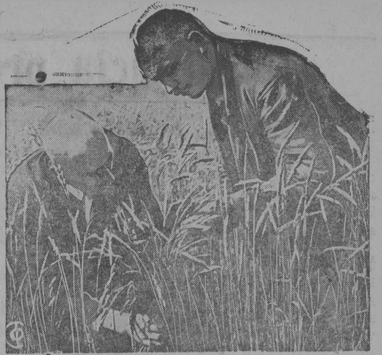
Gektar vliš loas „ne jeeazyk 100 pudša“

АДРЕС РЕДАКЦИИ: п. Кудымкар Свердловской области.