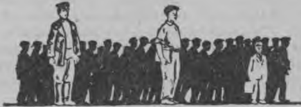
Крэстйан — 45. Пашазэ — 44. Служышо — 11. ВЛКСМ-ыштэ кө шога.

пашазэ клас вуйлатымэ дэн вэлэ сэнгэн, манын мэ ындэ тылэч ожно палэн нална вэт. Тудым комсомол шотышто ончэна гын, туштат вуйлатымаш пашазэ ужашыжын кидыш- тэ лийман манап күлэш.