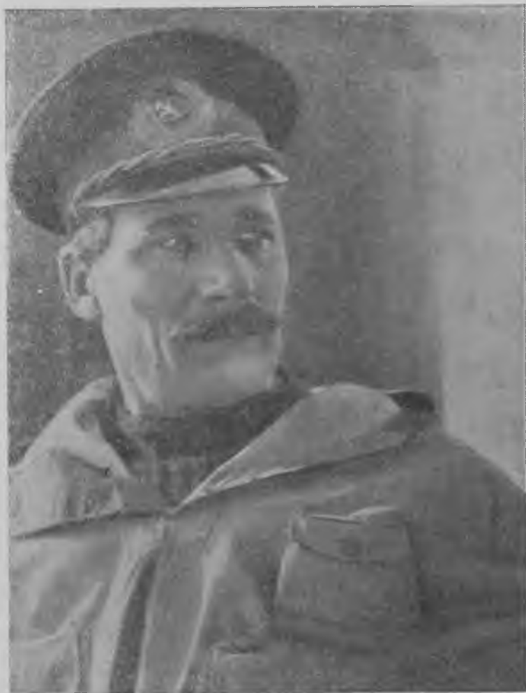
„Челюскин“ парходть капитаноц ордёноносец В. ВОРОНИН.

Ся пингть ушедсь весь. Аньцек тя весь аф стама, кодама везде, а особеннай полярнай ве. Сон таргави лама кофт. Лама ковонь ётамс флангс аш ши, наголь шобда, наголь ве. Аньцек кой-мзярда цифторгоды севернай Сияниясь.