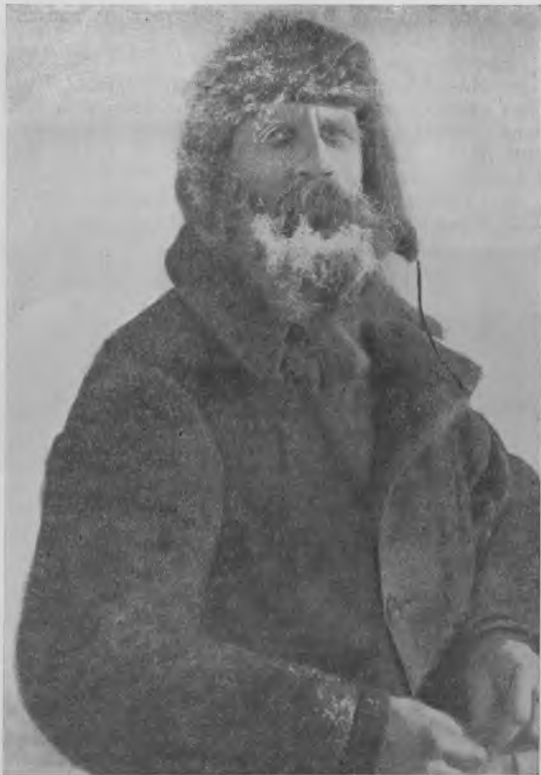
Советский Союз герой ОТТО ЮЛЬЕВИЧ ШМИДТ.