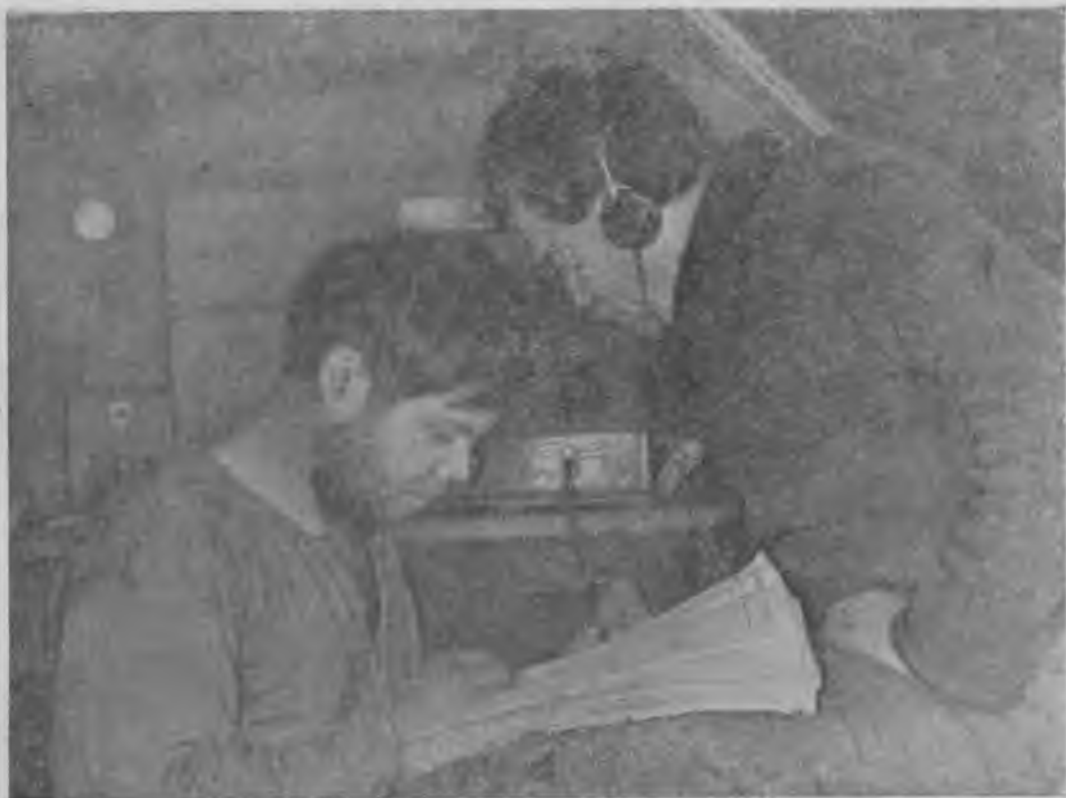
Советский Союзонь геройсь Э. КРЕНКЕЛЬ и ИВАНОВ радистсь.

Васень веня сембе удость видеста эйть лангса, кукуля—удома кяскафнень потмоса. А шобдава сразу сембе кундасть работама. Финцне кармасть палаткань стяфнема. Омбонцне таргасть ведста шочкт, боцькат, ящикт—сембонь, мезяма, кеподсь „Челюскинда“ меле ветть лангс.