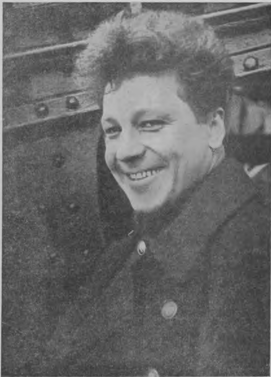
Советский Союз герой АНАТОЛИЙ ВАСИЛЬЕВИЧ ЛЯПИДЕВСКИЙ.