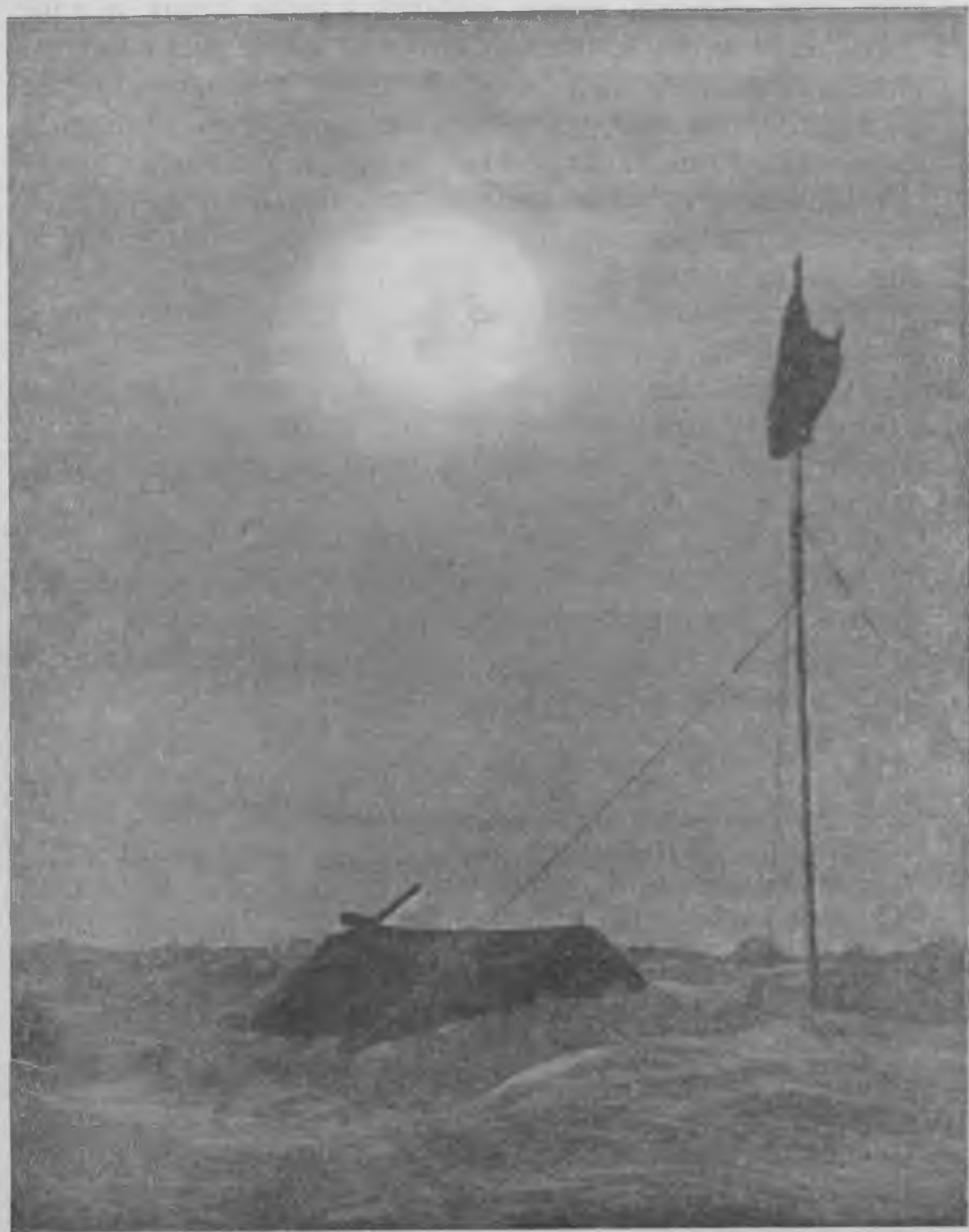
Тоса, коса зрясть челюскинеце, гордайста. либорьди Советснй Союзонь флагсь.