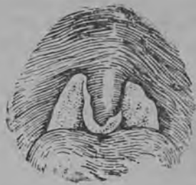
1-це рис. Нильхксонь дифтериясь. Налёттне вельхнесазь ёмла кяльнять, миндалинатнень и кургонь ляпе нёбать.

Стака форматъ пингста нильхксонь и шалхка потмонь ткаттне пяк таргозихть, идсь ваймонц тарксесы стакаста, вельхтявихть налётса миндалинатне, ёмла кяльнясь, ляпе и калгода нёбась, стакаста марясы прянц и кальдявгоды сонь сердечно-сосудной деятельностью. (1-це рис.). Дифтериять стака, или токсической пингстон-