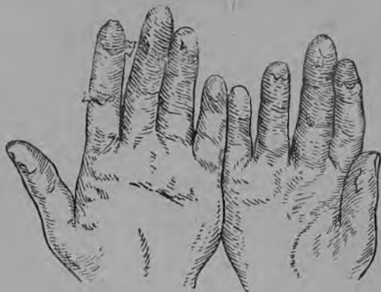
3-це рис. Скарлатинанть пингста сурхнень кедь каямасна.

Кой-коста скарлатинаса сяряткстомасень васда аф содави: температурась кепси аньцек 37° десятай мархта; сыпсь, пяк лофтана и кржа, эряй аньцек несколько част; ангинась цють няеви. Идсь эсь прянц марясы