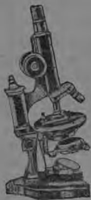
2-d сөр. Мi- кроскоп.