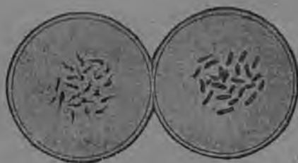
3-d сєр. Шужгаладорас колера-гагјас.

лõны, лõны-нын нол-гаг. Колера-гагјас жєныд- -немаõс: олõны сõмын кыҗ-,комын-минут. Сіҗ-кõ, быд-часжынõн быд-гагыс кык-гаг артмõ. Тырмы- мõн-кõ ескõ налы сојаныс вõлі да некõд-кõ ез вiав најõс, најõ ескõ мутõ ставнас тыртисны, јõзлы да кывтõм-пемõсјаслы некõн лоi овны. Ладнõ мiкробјасыдкõд пыр ыжыд-вен мунõ: јõ- зыд вiалõны најõс лекарствојасõн, сõстõма-олõ- мõн-да. Сõстõма-олõмыд лок-вõчыс-гагјаслы зев