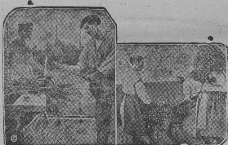
СНИМКАСОНТЬ: Вить енсо таргить лен ды стьявтить сонзз пултс, керш енсо—чалгить лен

ВКП(б)-нь крайкомонь секретарсь—М. Хатевич.