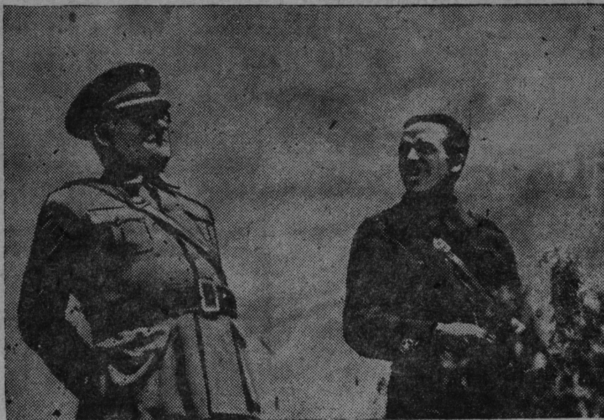
СНИМКАСОНТЬ: Миаха генералось ды Центральной фронтонь комиссарось Франциско Антон (виль ено) Испаниянь республиканской армиянь частьнестэ вейкентъ ванномсто.