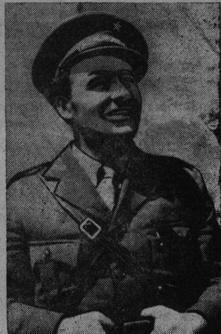
СНИМКАСОНТЬ: Испаниянь республиканской армиянь популярнейшей полководецэсь дивизиянь командиресь Эрикке Листер.

жностест мадезь удсемс. Весть неть тейтерь-аватненень якась священник, но сынъ эсть карма мартоно кортнеме. Священникесь грозясь, што сон тест кежентъ пандсы. Мейле састь марокканецт, кедьсэст ульнесь палкат ды илейть. Сынъ пек чавизь тейтерь-аватнень. Истя жо ульнесь изна-силованиянь ламо случайт. Фашисттнэ леднестъ 15 исезь церынетъ сень кис, што сынъ приветствиянь кис верей кепедилизь сюрордазь кулакокт.