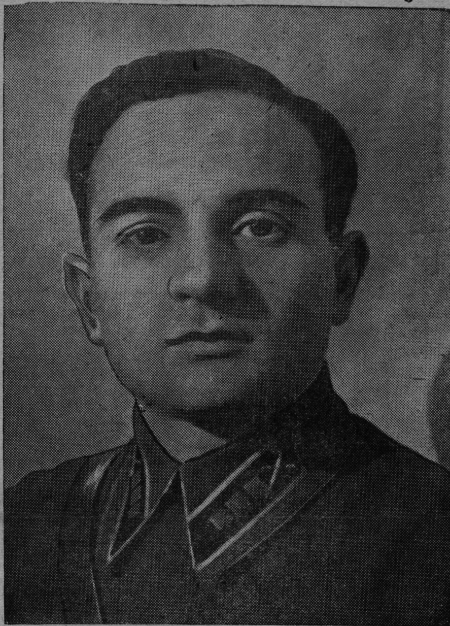
СНИМКАСОНТЬ: Советской Союзонь Героесь . Д. Л. Маргулис. (ТАСС-нь фото-клише).