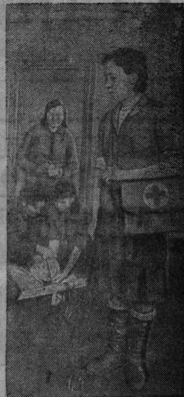
Отличницы производства изучают медико-санитарное дело.

В то время как Красная Армия продолжает продвигаться вперед в Венгрии и подошла к южным границам Чехословакии, наши союзники также одержали ряд успехов на западе. Они начали активные действия на всем протяжении фронта, от Северного моря до Швейцарской границы. Идет наступление севернее и южнее города Аахена по направлению к Кельну. Очищен от врага город Гейленкирхен и занято еще несколько других населенных пунктов на германской территории. Южнее союзники обошли и окружили немецкие войска во французской Крепости Мец. К северу от франко-