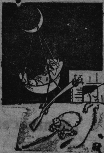
Илюшов и К. за „работой“