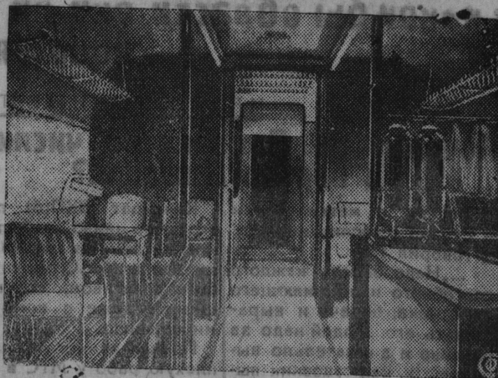
Легколет „Максим Горький“—величайший в мире. В сравнении с ним даже крупный тяжелый 3-4-моторный самолет кажется грушкой

НА СНИМКЕ: Внутренний вид самолета „Максим Горький“.