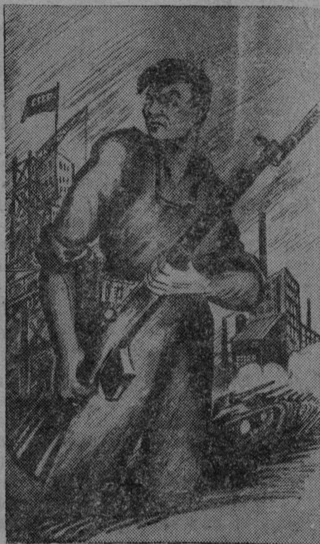
Фашизм снартни пайстома чис Каямс советской патриотонть. Робочей, весе рисксэнтъ кис Максик врагонть меельсь счетонть!

Эйкакшт! Врагось арси нельгемс тынк счастьяк ды весе сень, мезе максозь тенк Октябрьской социалистической революциядонть мейле социализмань мирной строямонть шкасто, мезе максь тенк советской правительствась, большевистской партиясь ты тынк вечкевикс тетянк великой ды мудрой Сталин. Штобу те войнасонть, конань кирвастизе минек масторонть каршо кровожадной Гитлер, чувомс калмо весе фашизматнэнь, тынк пельде эрви покштинэнь туртов лескс, колхозной производствасо ды промышленной предприятиясо упорной ды честной робота.