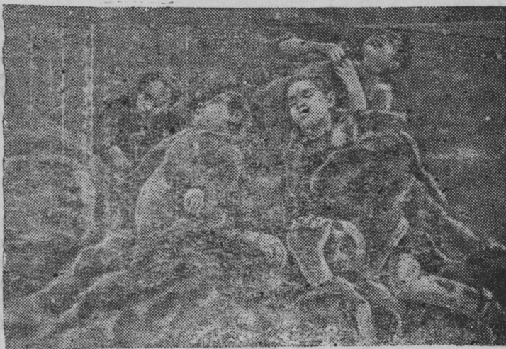
На снимке: Трупы расстрелянных.

В деревне 1-я Александровка, Колпинянского района, Орловской области, гитлеровцы замучили и расстреляли среди многих семью местных жителей.