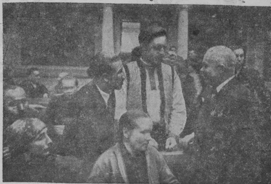
Украинской ССР-нь Верховной Советань внеочередной Колмоце Сессиясонть СНИМКАСОНТЬ: Н. С. Хрушев ялгась корти Западной Украинань Народной Собраниань Полномочной Комиссиянть члентнень марто.