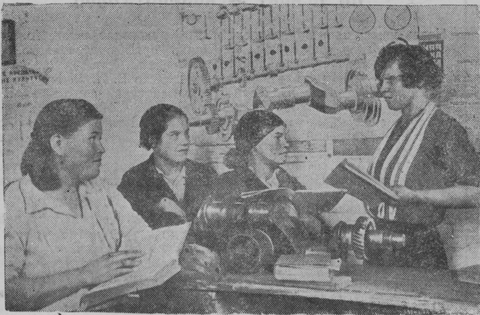
Мордовской АССР-нэ Атяшевской МТС-сэнтэ кармасть роботамо трактористкань курст.

Мон роботан долбежникекс механической цехсэ. Зярдэ-бути савкшнось тенсекшнемс заводской кардазонть. Ней мон квалифицированной рабочей-стахановец, мештемь лангсо—Ленинэнэ орден. Монь воспитал большевиктнэнь партиань, краснопролетариетчнэнь коллективесь жо товатымим трудямо. Ней мон эрва ковсто тонавтнян норман 300—400 процентс; башка читнэсэ жо тонавтнян малав сисем нормат. Ды заводсонть мон аволь ськамон. Зярдэ-бути