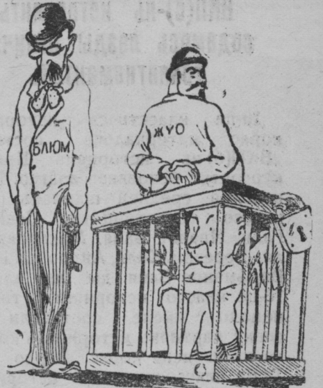
Истя сынь арсить „заключить мир“.