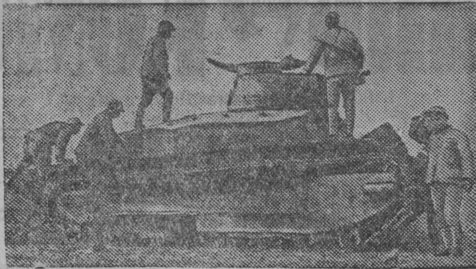
Китайсэ военной действиятнень

СНИМКАСОНТЬ: Китайской армиянь боецтнэ ванкшныть танконт, конань сынь сонзэ японской интервентнень каршо бойтнесэ.