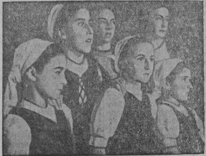
СНИМКАСА: баскониянь стирьнятнень хорсна, конац выступил хорса пяк оцю интерес мархта.

Парижи, республиканский Испаниять мархта солидарностьс часть баскониянь иттне.