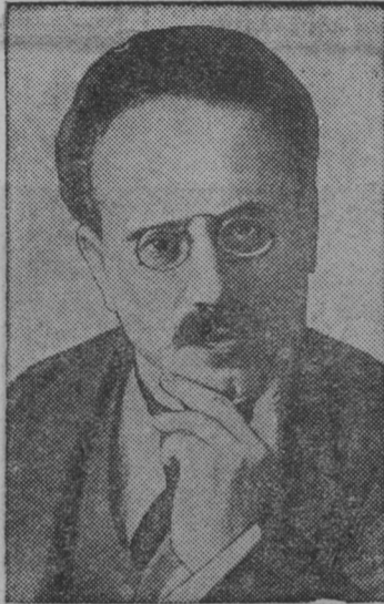
1939-це кизонь январь 15-це шистонза топодсь 20 киза германский пролетариатть вождензон Карл Либкнехтть и Роза Люксембургть шавома шистот сявомок.

Германияса буржуазнай революциясь 1918 кизоня йордазе императорть Вильгельмть и провозгла сил республика. Трудячайхне кармасть тиендема рабочайн и солдатский депутатонь советт, но советтнendi тага жа сувасть русский меньшевикнень кондыма социал-демократический соглашательхне. Синь лезксон вельде буржуазиясь шарфгозень германский советтнень эстейнза послушной орудиякс.