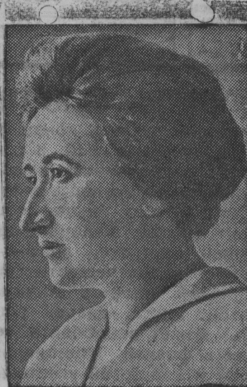
1939-це кизонь январь 15-це шистонза топодсь 20 киза германский пролетариатть вождензон Карл Либкнехтть и Роза Люксембургть шавома шистот сявомок.