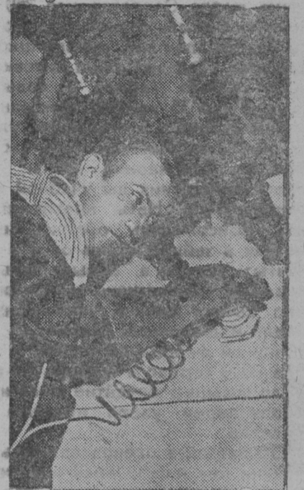
Лондонсто Гарри Май профессор, броневлававтомоилтнень изобретателесь, тейсь сех парсте куломань машина, кона ули невтезь всемасторлангонь выставкасонть Сан Диягосо (Калифорния). Снимкасонтэ: изобретателесь эсинзэ машинанть вакссо.