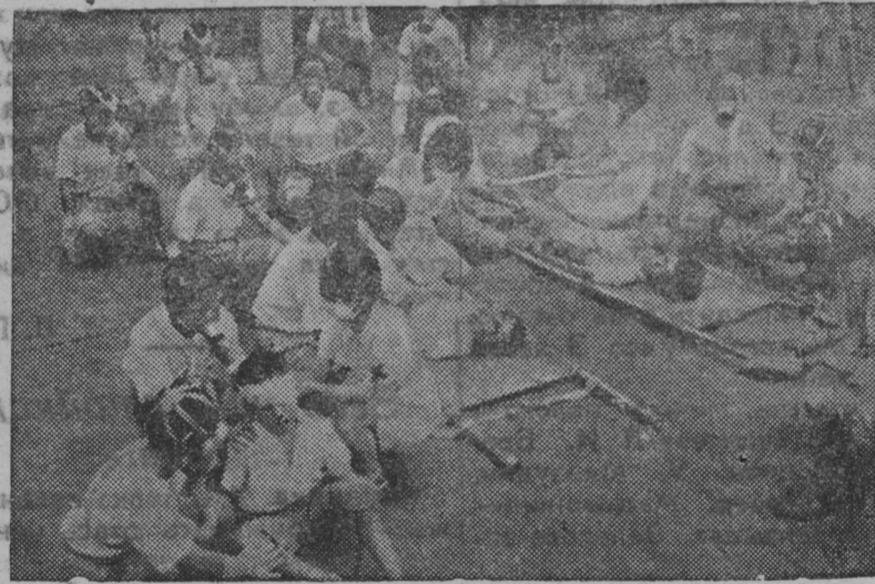
Снимкасонтэ: Токионь начальной школасо тонавтницятнень тонавить противогазсо прьян ванстомантьнень ды санитарной службас