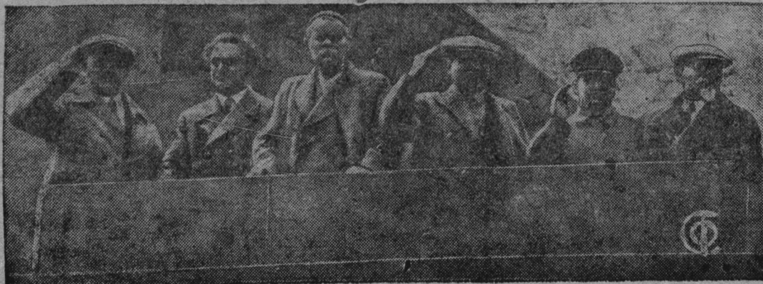
Снимкасонтэ: Сталин, Калинин, Жданов, М. Горький, Димитров, Шверник ялгатне Ленинэсэ мавзолейн трибунант лангсо.