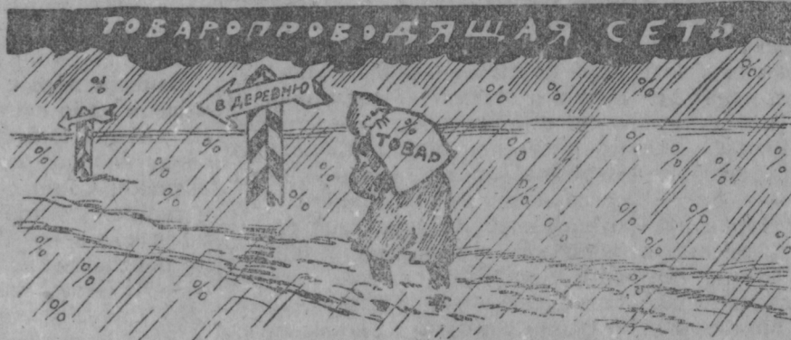
Кувака киява товаронь молимась фабрикасто теи покш наикдкат.