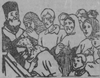
Повось маньчи аватонь

Ней ведь властесь эсинек, Жизнянтэ лучше тейсынек. Ялгат весе сыргозде, Властентэ вейсэ кирьцынек.