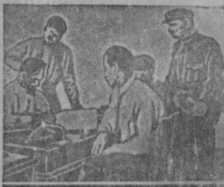
Партейной ячейкань секретаренть сокицятне кевкиснить, кода моли товароньпитнень дешувалгавтомась и тундонте прянь алонстамось