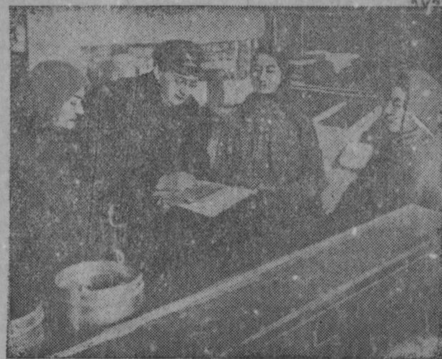
Лавкань комиссия ь заботи кода товаронть дешувалгавтомс