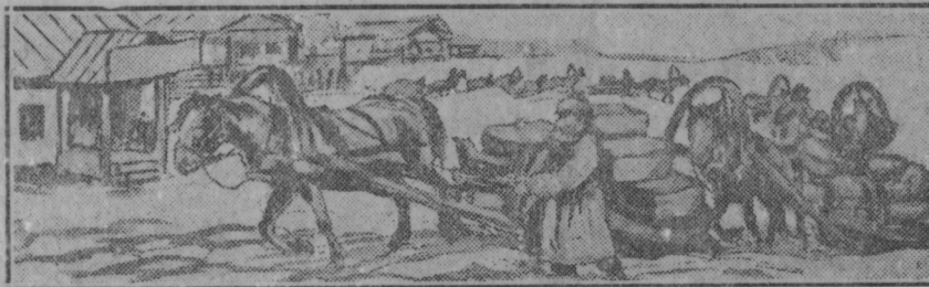
Икелень коряс дешува товарт ускить сокицетне велев.