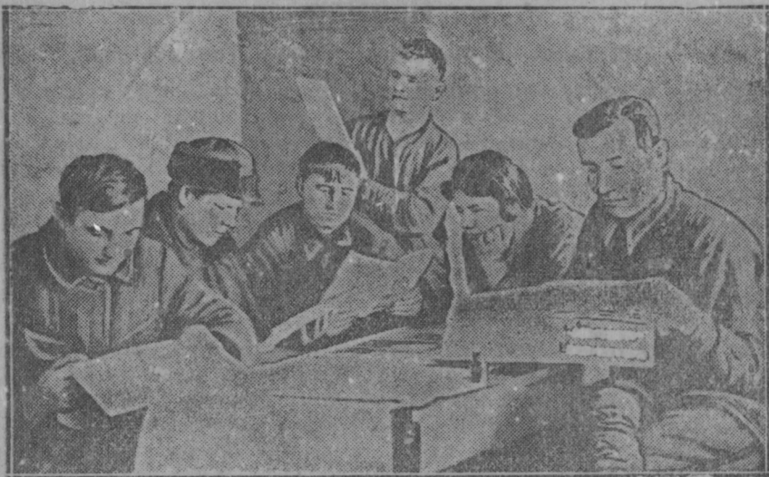
Велен Ловнумо Кудосо Ловный "Од-Эрямо" Эрва мезень кувалт.