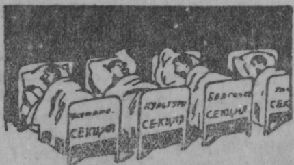
Стявтынк удомсто велень советен секциятнень. кадык кармить заботмо весе велень тевтнень кувалт: суро видиманть, товаронь дешувалгавтоманть... кувалт.