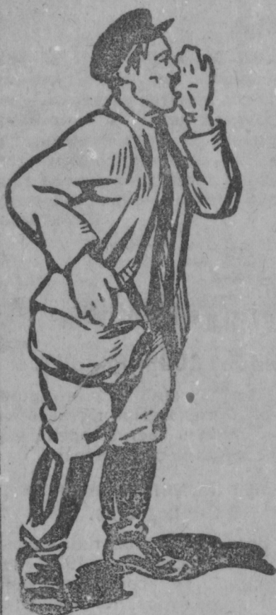
Сормацтода "Од-Эрямо" газет, сон эрва мезень кувалт корты, и кода товартень питнест дешувалгавтомс...