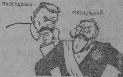
Генерал Пилсудской ды президент Мосциной.

Вильна ошцо пурназь сехти вадря войска, конань эйсо командови генерал Рыда-Смылской.