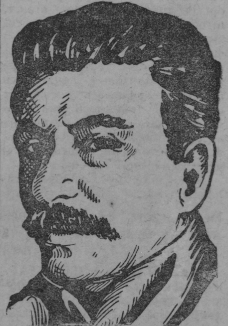
ЦК ВКП(б)-нь генеральной секретарь Сталин ялгась.

Но оппозициянтъ эзь кирдев партийной уставанть коряс за- конной мелень евтнима ды кисост ащимася и сынъ остатка шкань пелев овсе тунь калав- тызь и вакса ютысь X, XIII и XIV-це с'ездтнень постановлени- яст партиантъ вейкикс ащи- мантъ ды лувонь вацтомантъ ку- валт. Оппозициясь сонцинзэ сон партиантъ марто бороцямо тев сэнзэ кундась теиме салава пар- тиянтъ эйсто фракцият, конань штобо аравтомс партиантъ кар-