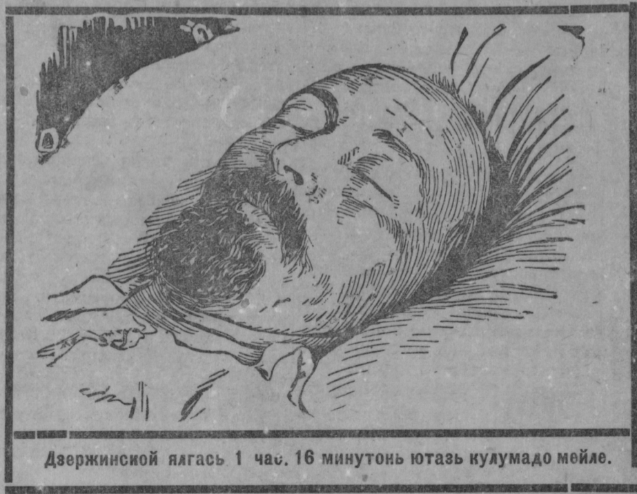
Дзержинской ялгась 1 час. 16 минутонь ютазь кулумадо мейле.

Те покш, стака минек вейсонь хозяйствасо таштамо ды ванцтома теветнень эряви кундамс эсиминень, и ошонь робочейтнень ды служащейтнень и велень сокицятнень ды веси роботникнень—эрьва теветсь ды общественной хозяйстванть эрьва таркасо. О П-ва.