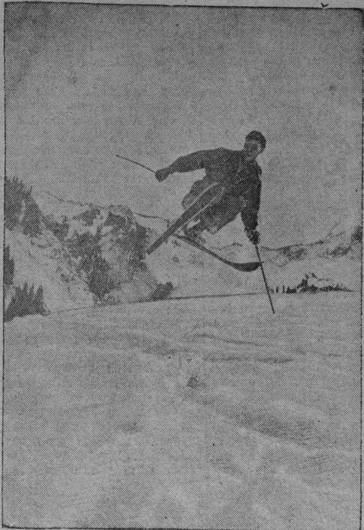
Алма-Атать окрестностьса горно-лыжной школась (Зайли-ский Алатау) аноклай горно-лыжной спортонь инструкторт-общественникт.

СНИМКАСА: Палка вельде лыжа лангса комотемань тренировкась.