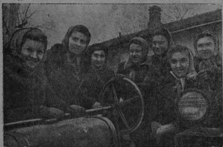
Молдавский ССР-нь од райоттнень эса тяде организавандавихть 20 МТС. Кафта школава аноклавихть трактористт и лия механизаторский кадрат.