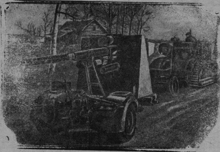
На снимке: Дальнобойное германское орудие, брошенное немцами при отступлении из пункта Ш.