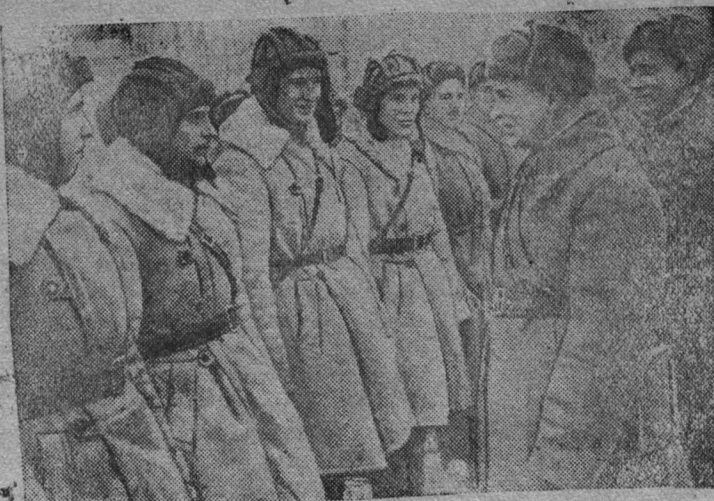
Командир гвардейской дивизии Герой Советского Союза Генерал-майор тов. Лизюков беседует с гвардейцами танкистами.

Героически сражаются с фашистскими бандитами танкисты 1 Гвардейской мотострелковой Московской дивизии.