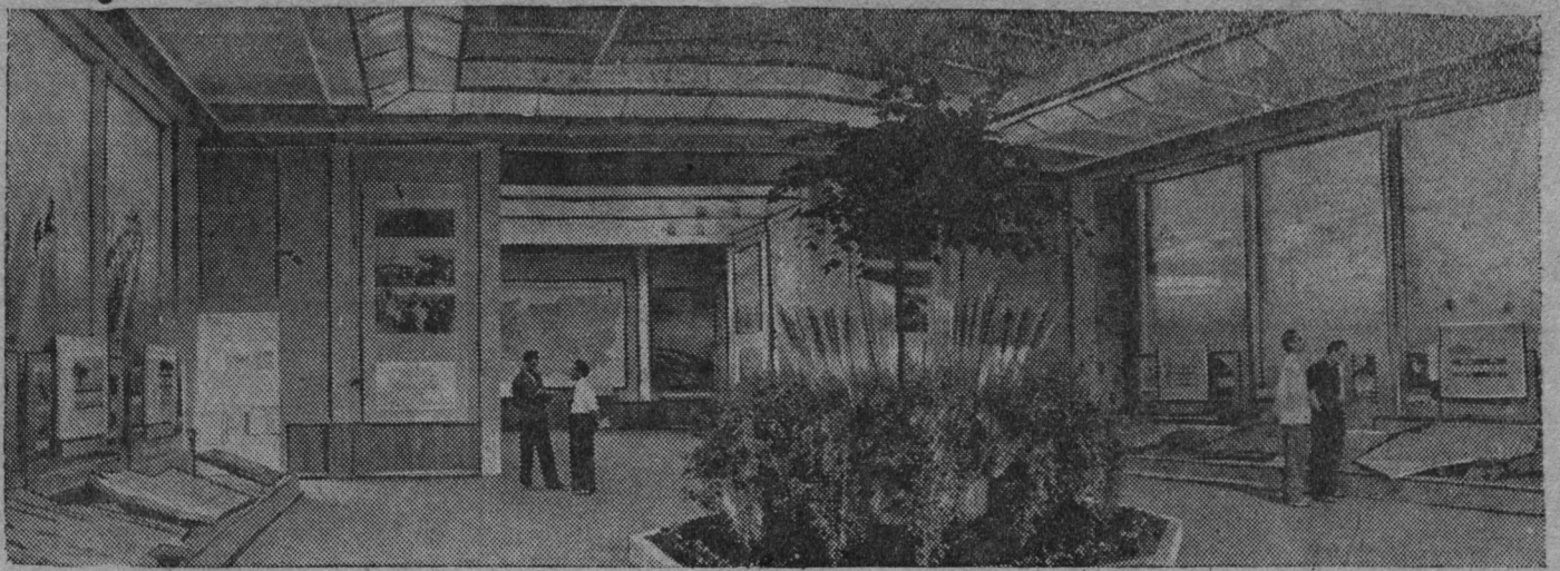
Всесоюзной Сельскохозяйственной Выставкань павильонть потма ширде видоц.

Государствати хлебопоставкати планонц пшкодема районца инь васенда ушедсь „Юлдус“ колхозсь. Июльть 21-це шистонза сон госу-дарстват макссь пшкотькшесазь 25 центнер сьора.