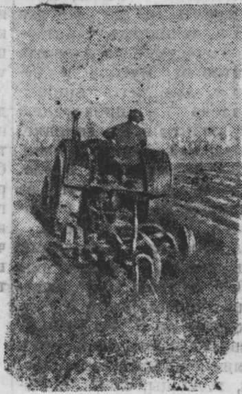
Весенняя пахота в колхозе имени ОГПУ аулсовета Дженгель. (Туркменская ССР).