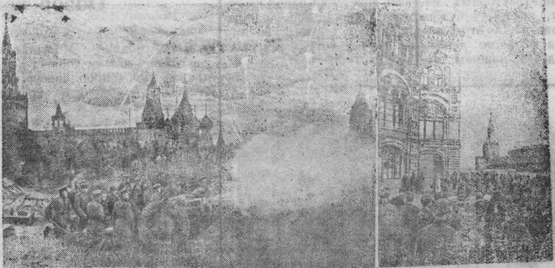
В родной столице.

За время с 7 по 13 сентября наши войска на всех фронтах подбили и уничтожили 412 немецких танков. В воздушных боях и огнем зенитной артиллерии сбито 280 немецких самолетов.