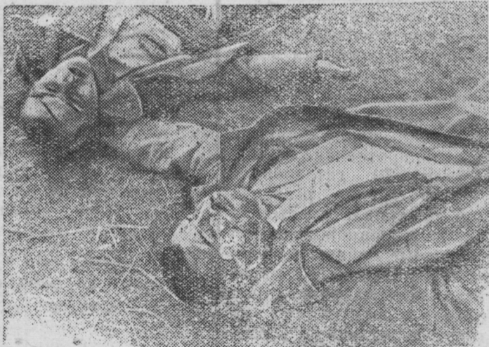
Трупы убитых, обнаруженные нашими бойцами при занятии села Генераловка.

В селе Генераловка Ростовской области гитлеровские бандиты замучили и убили 13 пленных красноармейцев