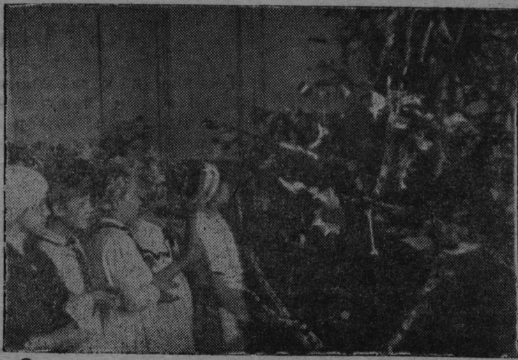
Йошкар-Оласэ 5-шэ №-ан школышто тунэмшэ-шамыч у ий йолкышто модыт.