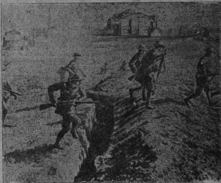
Китайысэ войэннэ дэйствий. Сүрэтгыштэ: Китай армийы бойэцшэ-шамыч наступатлымаштэ. (Центральный Китай).

Китай калык сэнга! М. Тамарин. "Колхозные ребята" газэт гыч.