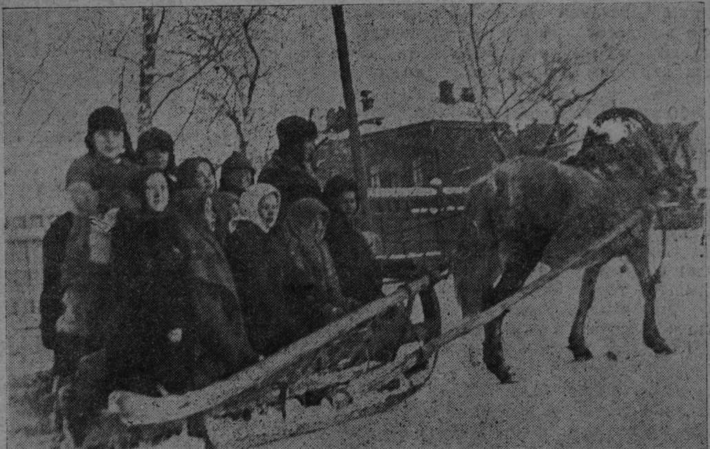
Арбан пэлэ кыдалаш школышто тунэмшэ-шамыч (Иошкар-Ола район) Иошкар-Олаш „Ленин в Октябре“ кинофильмым ончаш кайат.