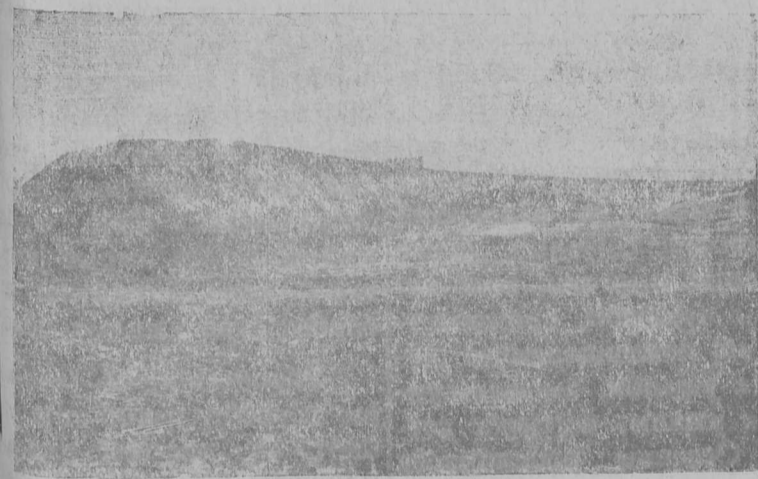
Көрттуј насып Вьльгорт туж бокин.

Нөлөд-кө, Поруб ју бердын өбөлөдованьөјас