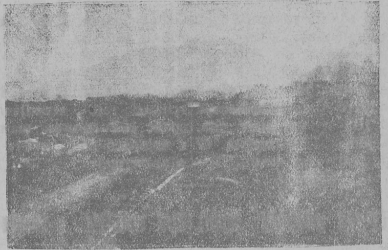
Көрттуј насып Сыктыв пөлөн.

Төвнас егкө мјан ро- бочөјјас агныс заптасы колан вөрсө, сөмын-өд тајө вөрсө почас кылөдны Сык- тывкарас тулысын-на, а сек