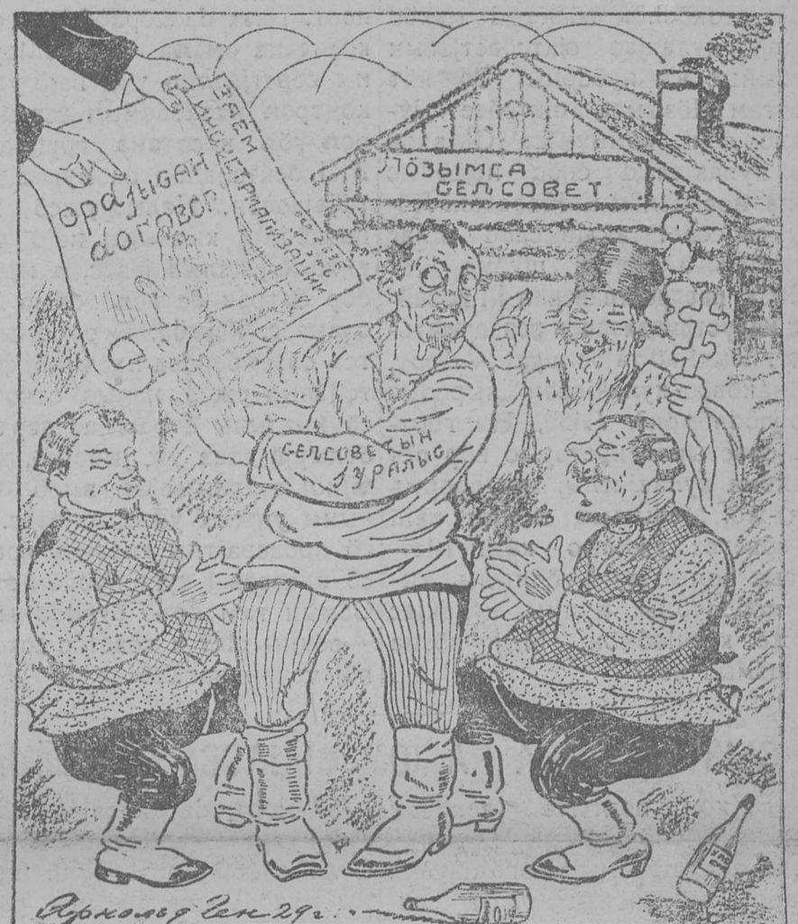
Кодјас кыскөны Лөзымса сельсоветыс ужалысјасөб?

Новосөбирск. Ылын војвылын, полярнөј круг сайын, Јенөсөј усан Ігар нима ју вылын лөбөдөдөсны гавань. Тајө гаваньыс зөв жужыд да лоас медбур речнөј гавань ставмувылын. Гаваньыс өні сулалө 20 судна да море вытө ветлан 7 парекөд. Кујим төлыс сайын тајө местаас вөлі сук тајга, а өні другөн быдмис робочөј поселок, ештис вөр пилтан завод, кодө төлыс мыст мөдас ужавны.