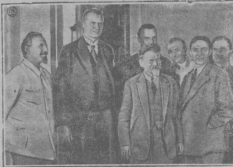
Јул 8 лунб Мбскуаб воіс дантагыс сенатса прбсбдатель Заам. Сјјб-жб рытнас Налынын прімітсб сјјбс Кремльса ыжыд дворечын. Картїна-вылын: Нарахан, Заам, Налынын да Уханов.