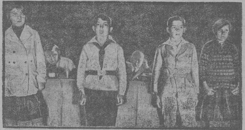
6ни мун6с германіяјас компартіјал6н XII-6д сјезд. Картина - вылын: п6н6ер делегатсја чол6мбыт6д6л6 сјезд.