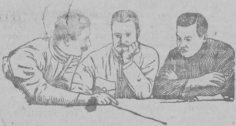
Буденный, Фрунзе, Ворошилов.

завоеваний Октября, в жестоких боях с многочисленным и, в военном деле, опытным врагом рождалась, крепла и закалялась армия