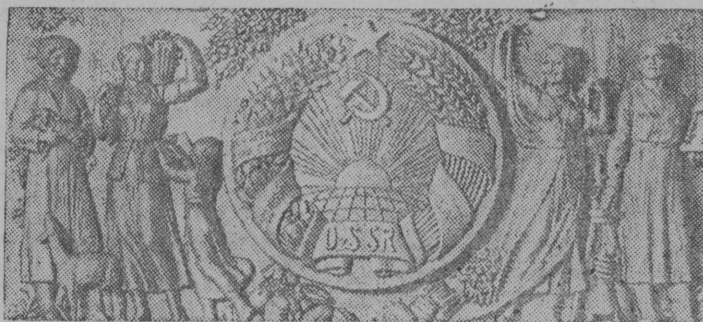
Снџмок вьлын: Барельєф „УзбССР“ (ескџ).

Нју-Йоркын међународнӧй выставка вьлын СССР-лӧн павилјон.