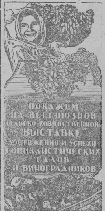
Снимок выльн: Худо- ж- никјас В. Г. Клинчлөн да Б. М. Фридкинлөн плакат, кодбс лөзөма Ставсојуз- са Селскохозгајственин Выставкаса Главнөй Ко- митетдн.

Јул 6-өд лунд, Кослан сиктсбветуws комиссија заводитчис ужб. Мерај- тисны приусадебнөй учас- токјас „XII октабр“ кол- хозса колхозникјаслыс.