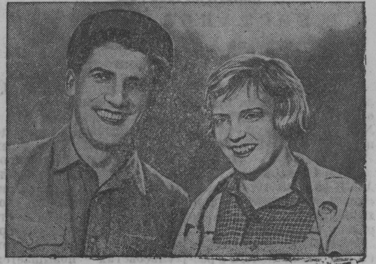
Фильмысь öти кадр.

Ленин ордена киностудия „Мосфильм“ лэдзис выль звуковöй художественнэй фильм „Трактористы“.