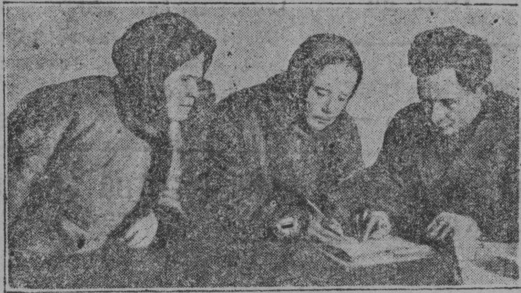
БЕРПАС ВЫЛЫН: Колхозницајас гижөны зајом вылө,

|| || || | ЛОВКОЖ ДА ПУЧКОМО, ГИЛОС ПЛАН ТЫРТӨМ ГУАЛӨНЫ КУЛАЦКОЈ ГУӨ || || || |