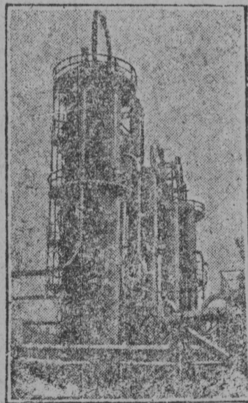
СЕРПАС ВЫЛЫН: Выль пач Крегинга.